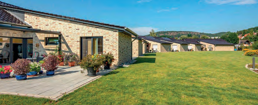
Der energieeffiziente Lammepark in Bad Salzdetfurth.