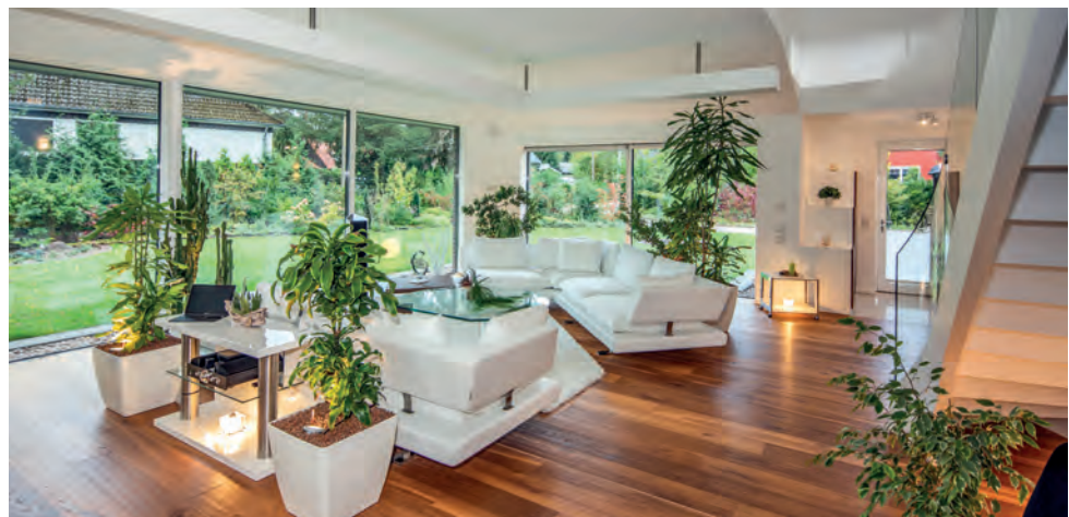
Freier Blick in die Natur: Weitläufige Fensterflächen sorgen für viel Licht und ein luxuriöses Wohnambiente.

Ein ganz besonderes Paradebeispiel hierfür ist das von BAUMEISTER-HAUS gebaute Haus Leinweber. Ein Haus, das als Vision im Kopf seines Bauherrn bereits bis in die Details ausgedacht und genau so von unseren Bauspezialisten in die Realität umgesetzt wurde. Ein Haus, das so außergewöhnlich ist, dass es jeden auf den ersten Blick beeindruckt. Und auf den zweiten sowieso – denn wer hat schon seinen eigenen Heimkinosaal?