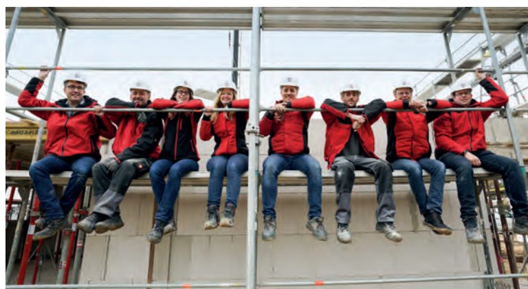
Das Team von Splietker Bau.

Die Splietker Bau GmbH & Co. KG aus dem nordrhein-westfälischen Rheda-Wiedenbrück gehört zu den namhaften Baupartnern in Gütersloh, Warendorf, Lippe, Bielefeld und Umgebung. Als verlässlicher Partner setzt das in der Region verwurzelte Familienunternehmen darauf seine Bauherren mit einem neuen Zuhause glücklich zu machen. Individuell, nachhaltig, massiv, schlüsselfertig und regional – so lauten die Grundpfeiler des erfahrenen Teams des Bauunternehmens, das sich 2019 in der vierten Generation noch einmal neu erfunden und mit neuen Partnern neu gegründet hat. Mit frischen Ideen, flexiblen Organisations- und Kommunikationsstrukturen wie in einem Start-up, dem Fokus auf Digitalisierung und einer offenen wie fairen Unternehmenskultur ist Splietker Bau fit für die Zukunft. Beim Bau von Einfamilienhäusern und Doppelhäusern bis hin zur Bauland- und Projektentwicklung ist das ostwestfälische Unternehmen, das auch über eigene Maurer und Stahlbetonbauer verfügt, mit einem Rund-um-Service an der Seite seiner Kunden. Die gesamte BAUMEISTER-HAUS Kooperation