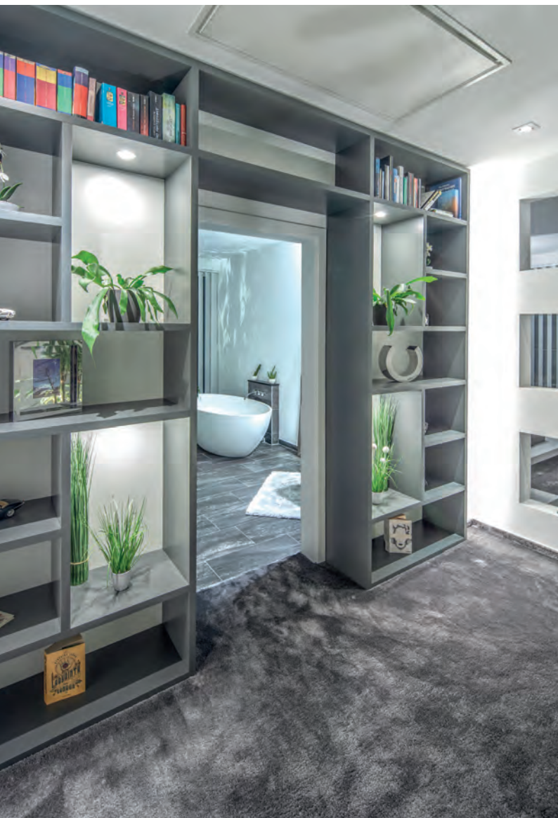
Raffiniert platziertes Regal mit Durchgang zum Luxus-Bad.