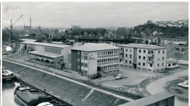
Das alte Bürogebäude der Bauunternehmung Böppler in den 1960er Jahren.

Wir gratulieren zu den BAUMEISTER-HAUS Jubiläen unserer Nordlichter.